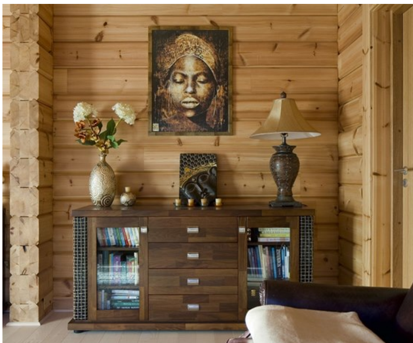
Plakát z USA putoval na Slapy z Brna. Nad komodu v ložnici dobře "zapadl".

V citlivě zařízeném domě se majitelé i jejich hosté cítí velmi příjemně, čemuž napomáhá všudypřítomné masivní dřevo, které vytváří jedinečné vnitřní prostředí s příjemným klimatem, kterého si majitelé, "zocelení" bydlením v rušné a prašné brněnské čtvrti, velmi cení.