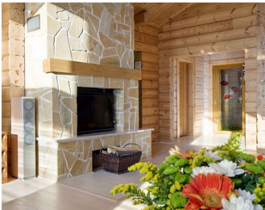
Krb s krbovou vložkou je obložený přírodním kamenem.

Hosté zde najdou řadu příjemných detailů, které dokazují, že výsledný dojem z interiéru nezáleží ani tak na financích jako na celkovém sladění. To je třeba případ obrazu černošky nad komodou v ložnici.