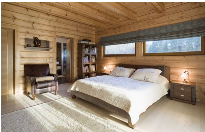
Ložnice s citlivým zastíněním oken nad lůžkem

Každý montážní tým musí být vedený certifikovaným mistrem a jeho zástupcem. Nestačí jen obecná tesařská dovednost, případně takzvaný certifikovaný dozor jednou týdně. Na rozdíl od zděné výstavby totiž nelze již po zabudování některé chyby odstranit.